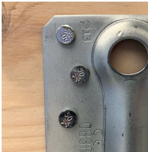
El marcado en el conector, además del marcado en las cabezas de las puntas, permite una fácil verificación después de la instalación.