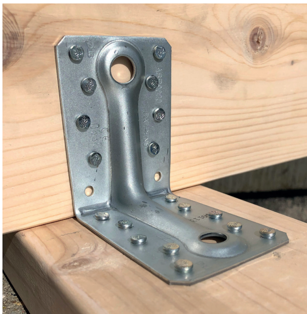
Escuadra reforzada ABR9020 instalada con puntas para conectores CNA4.0X50.

Las puntas CNA, que tienen esta nueva cabeza, están disponibles en diferentes longitudes y tamaños. Consulte la página siguiente para obtener más informaciones.