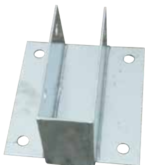
Peças soldadas mecanicamente